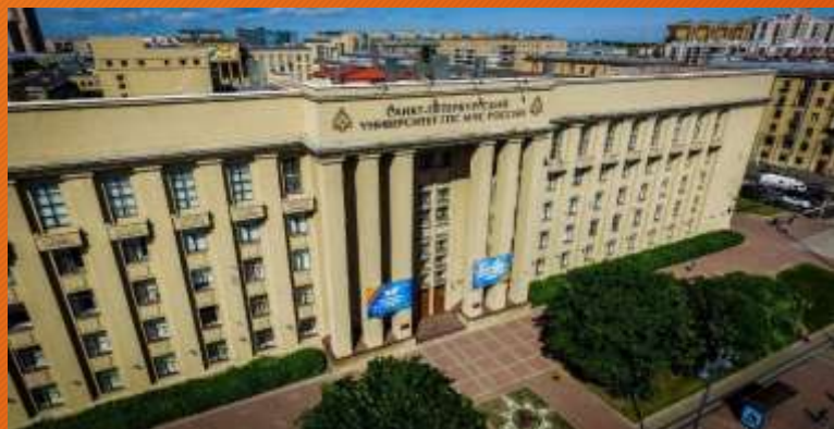
Санкт-Петербургский Университет ГПС МЧС России