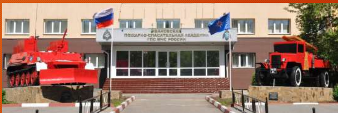
Ивановская пожарно-спасательная академия ГПС МЧС России