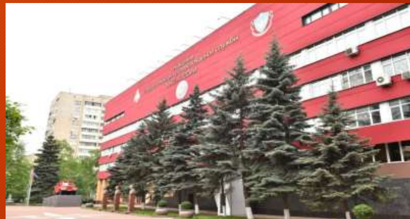
Академия ГПС МЧС России г. Москва